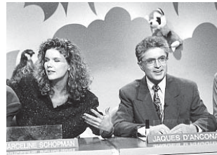
Bij Waku Waku.