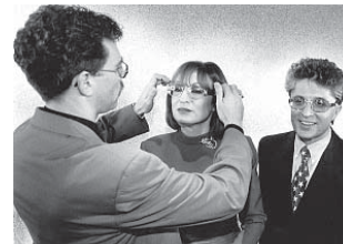
Een eigen brillenlijn.