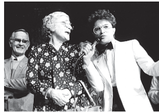
Op het podium.