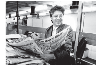
Bij Nieuwsblad van het Noorden.